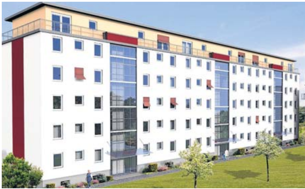
So soll es an der Eschenstraße in drei Jahren aussehen.