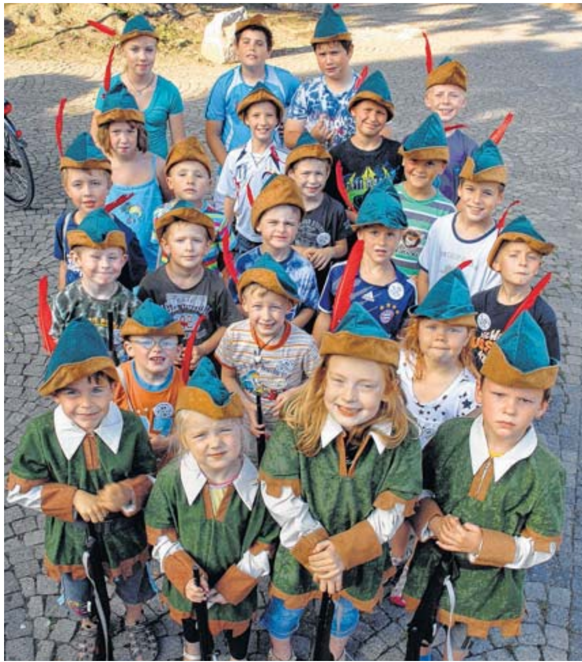
Ganz schön fesch: Im „Robin Hood“-Look stellten sich die frisch eingekleideten Orsoyer Kindergrenadiere vor.

Jeden Mittwoch um 18 Uhr werden die Holzgewehre geschultert.