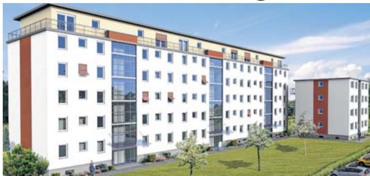
Nach diesem Plan werden Häuser in der „Reichel-Siedlung“ saniert.

Für 36 der 44 Wohnungen gebe es inzwischen Mietverträge oder Mietvertragszusagen; die Wohnungen seien barrierefrei, dies schein aber in Rheinberg nicht hinreichend bekannt zu sein, erläuterten Gesprächsteilnehmer. Die Investoren zeigten sich etwas verwundert, dass dieser Umstand bei den Mietanfragen sichtlich kein Thema ist. Dies sei insofern nicht nachvollziehbar, da der Bedarf an barrierefreien Wohnungen in Rheinberg bisher größer als das Angebot ist. Da die Wohnungen im zweiten Bauabschnitt ebenfalls barrierefrei geplant sind, versicherten die Investoren, dass Mieter, die eine sol-